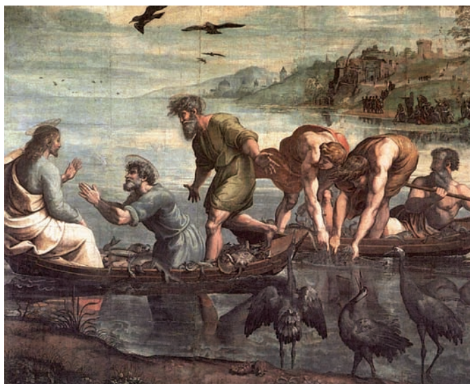
Rafael Sanzio, La pesca milagrosa (1514). Londres.