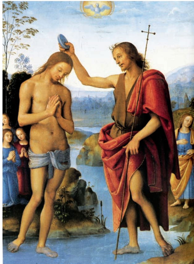
El Perugino, El Bautismo de Jesús .

Por entonces fue Jesús desde Galilea al Jordán y se presentó a Juan para que lo bautizara. [...] Jesús se bautizó, salió del agua y al punto se abrió el cielo y vio al Espíritu de Dios que bajaba como una paloma y se posaba sobre él; se oyó una voz del cielo que decía: Este es mi Hijo querido, mi predilecto. Mt 3, 13-17